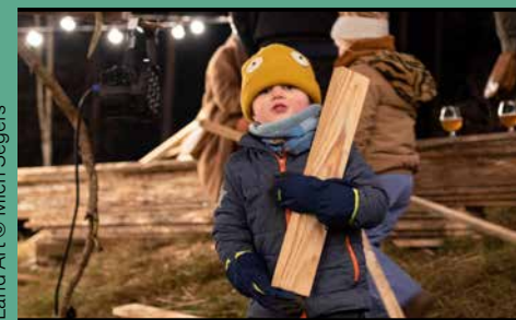
Land Art © Mich Segers