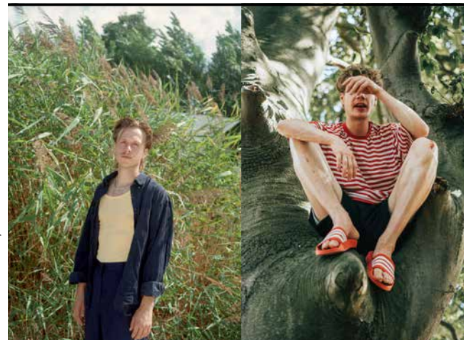
© Darwin Cabrera / Ruben Boidin